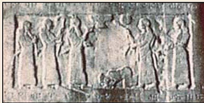
Der Schwarze Obelisk des Salmanassar III. bekundet die Herrschaft Assyriens über seine Nachbarn. In den Szenen, welche die Überreichung des Tributs darstellen, huldigt der israelitische König Jehu (oder ein von ihm Gesandter) dem assyrischen Herrscher.