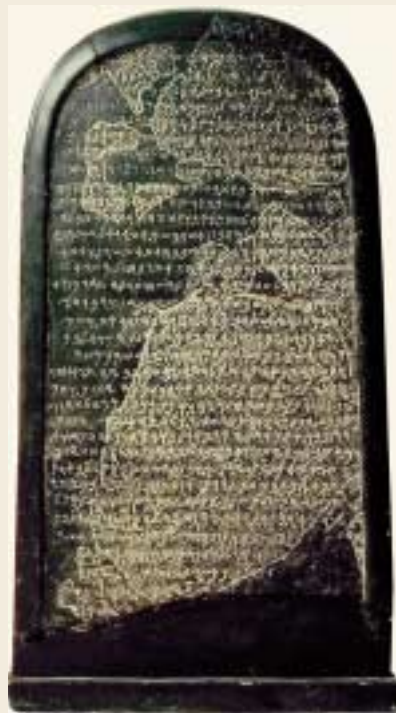
Der Stein der Moabiter bezeugt die Rebellion der Moabiter gegen drei Könige Israels — Omri, Ahab und Joram —, die in 2. Könige 3, Vers 26-27 beschrieben ist.

Der König Mescha war zwar erfolgreich, aber in seiner Inschrift auf der schwarzen Steinplatte läßt er den hohen Preis unerwähnt, den er für die Unabhängigkeit seines Volks zahlte.