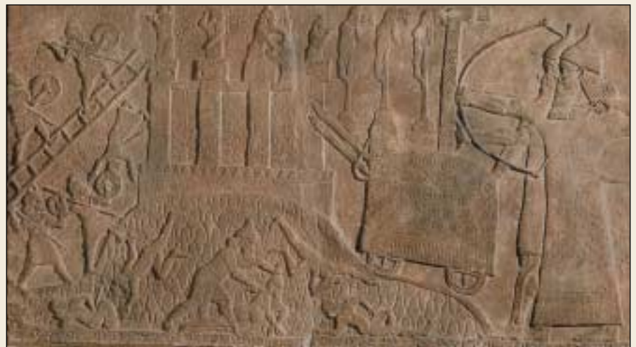
Die Assyrer verbreiteten Furcht und Schrecken, wenn sie Nachbarvölker überfielen. Dieses assyrische Flachbild zeigt die Einnahme einer befestigten Stadt. Der Bogenschütze rechts wird von einem Schildträger gedeckt. Vor ihnen werden mit einem Rammbock auf Rädern Löcher in die Stadtmauer geschlagen. Oberhalb des Rammbocks sieht man drei aufgespießte Verteidiger. Links im Bild: Assyrische Fußsoldaten klettern auf Sturmleitern die Mauer hoch.

Die Assyrer, die mit großer Sorgfalt die Siege ihrer Könige für die Nachwelt festhielten, erwähnen diesen Tribut, den König Menahem zahlte. Die Übereinstimmung mit der Bibel ist auffallend: „Das hervorstechende Ereignis während der Herrschaft Menahems“, bemerkt das Bibellexikon The Interpreter's Dictionary of the Bible , „war die Ausdehnung des assyrischen Machtbereichs nach Westen. [Die biblische Darstellung] wird ausführlich von assyrischen Quellen bestätigt ... Als Tiglat-Pileser III. von Assyrien im Jahre 729 den Thron Babylons bestieg, gab er sich den Namen ‚Pulu‘ [in der Bibel mit ‚Pul‘ wiedergegeben] ... In seinen Annalen verzeichnet Tiglat-Pileser den Empfang von Tributzahlungen von verschiedenen ►