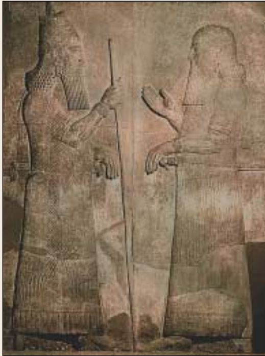
Der Eroberer Israels, König Sargon von Assyrien (links), empfängt einen Bericht von seinem Heerführer Tartan. Die Assyrer hielten ihre Siege auf Reliefs wie diesem für die Nachwelt fest. Dieses Exemplar wurde in einer einstigen assyrischen Hauptstadt ausgegraben.

dem Zeitpunkt an verschlimmerten sich die Zustände in Israel drastisch. Als Folge davon konnte das Reich nicht mehr mit dem Schutz Gottes rechnen. Gesetzlosigkeit und Gottlosigkeit nahmen überhand.