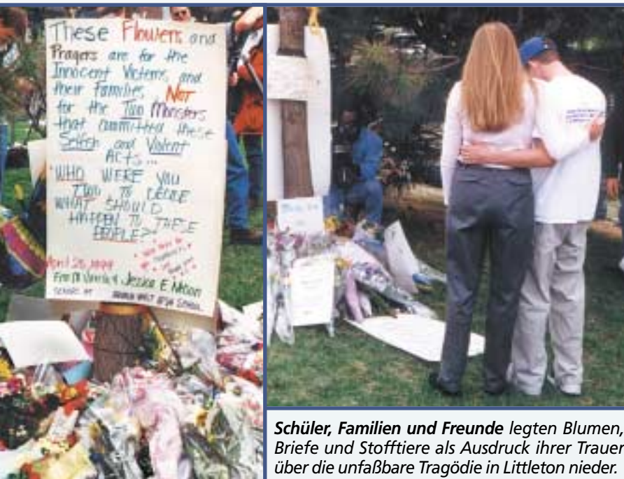
Schüler, Familien und Freunde legten Blumen, Briefe und Stofftiere als Ausdruck ihrer Trauer über die unfaßbare Tragödie in Littleton nieder.

Sehen Sie sich zuerst die groben Zahlen an. Die 1997er Ausgabe des dtv-Lexikons beinhaltet eine Aufzählung der Weltreligionen. Ihre Verfasser geben zu, daß eine solche Zählung uns bestenfalls eine ungefähre Schätzung geben kann, doch selbst eine