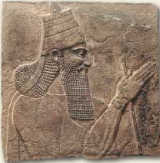
König Tiglat-Pileser baute Assyrien zu einer überregionalen Macht aus. Kleine Nachbarländer, darunter auch Israel, verlebte er seinem Reich ein.

Wie von Gott angekündigt, hatte die Dynastie Jehus nur „bis ins vierte Glied“ Bestand. Jerobeam II. war die dritte und sein Sohn Secharja der Vertreter der vierten Generation. Dieser erlag während des ersten Jahres seiner Herrschaft einem Mordanschlag. Von