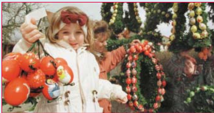
Das Schmücken des Osterbrunnens ist eine beliebte Tradition. Rund 1800 handbemalte Eier zieren diesen Dorfbrunnen im Nürnberger Land. Wußten Sie, daß Ostereier ihren Ursprung in frühen heidnischen Fruchtbarkeitskulten hatten?

Die Passazeremonie, die Jesus und seine Jünger gehalten und geboten haben (1. Korinther 11,23-26; Lukas 22,19-20; ▶