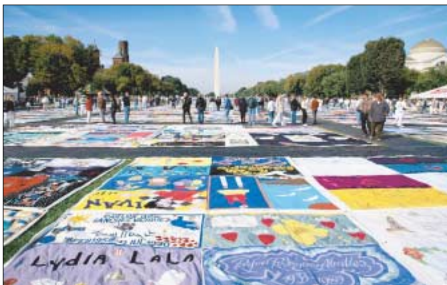
Die AIDS-Steppdecke, hier in Washington, D.C. (USA) ausgestellt, trägt die Namen von mehr als 80 000 AIDS-Toten. Die Steppdecke, die mehr als 50 Tonnen wiegt, ist ein erührenderes Mahnmal an diese tödliche Epidemie.

In diesem Zusammenhang ist ein Leserbrief an die Redaktion von Newsweek als Reaktion auf die eingangs zitierte Sonderausgabe der Zeitschrift zum Thema AIDS beispielhaft: „Auf vierzehn Textseiten wurden die Begriffe ‚Gelegenheitssex‘ bzw. ‚sexuelle Freizügigkeit‘ kein einziges Mal erwähnt, obwohl dieses Verhalten die unmittelbare oder mittelbare Ursache von 98 Prozent aller neuen Infizierungen in Afrika ist. Die Tatsache, daß HIV eine sexuell übertragbare Infizierung ist, wurde auch nicht einmal ange-deutet“ (Hervorhebung durch uns).