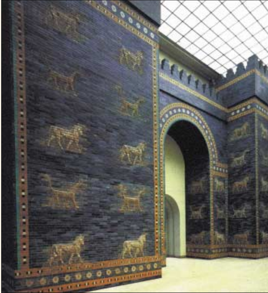
Das Ishtar-Tor, der Haupteingang der Stadt Babylon, wurde während der Herrschaft des Königs Nebukadnezar (605-562 v. Chr.) gebaut und war der babylonischen Fruchtbarkeitsgöttin Ishtar geweiht. Ein Teil des Tors und der Prozessionsstraße wurden restauriert und sind heute in dem Pergamon-Museum in Berlin ausgestellt. Nebukadnezar eroberte die Stadt Jerusalem und zerstörte dabei den Tempel Gottes. Die Juden führte er als Gefangene nach Babylon, wo sie 70 Jahre im Exil verbrachten.

großer Bauherr war, wird von der modernen Archäologie bestätigt.