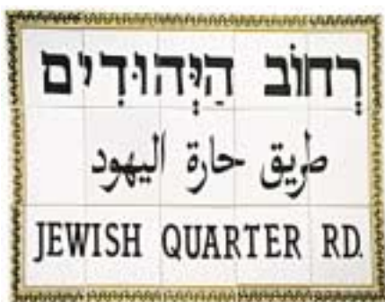
Ein Straßenschild aus Fliesen in Jerusalem — in Hebräisch, Arabisch und Englisch — erinnert an die unterschiedlichen Kulturen, die in der Stadt vertreten sind, und an ihre turbulente Geschichte.

Nach dem Scheitern der Camp David-Verhandlungsrunde im vergangenen Sommer konnte man die gewalttätigen Unruhen, die Mitte September in dem Palästinensischen Autonomiegebiet ausbrachen und immer noch andauern, nicht voraussehen. In den langwierigen Friedensgesprächen, bei denen der amerikanische Präsident Bill Clinton als Vermittler wirkte, hatte es nämlich schon mal Hindernisse gegeben, für deren Überwindung mehr Zeit — und eben weitere Gespräche — notwendig gewesen waren.