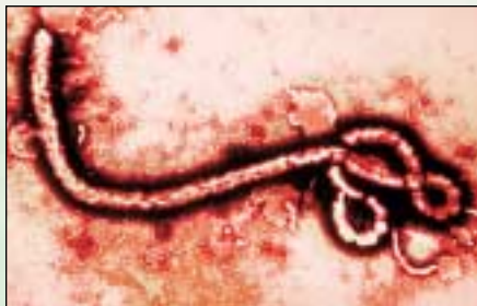
Der Ebola-Virus gehört zu den gefürchtetsten Erregern, die von Terroristen als Biowaffe eingesetzt werden könnten.

Der Bibel zufolge wird es eines Tages schlimme Waffen — vielleicht auch chemische und biologische — geben, wie wir sie uns noch nicht vorstellen können. Welchen Schutz gibt es vor den Waffen des Terrors, deren Einsatz nicht auszuschließen ist? GN