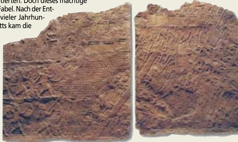
„Im vierzehnten Jahr des Königs Hiskia zog herauf Sanherib, der König von Assyrien, gegen alle festen Städte Judas und nahm sie ein“ (2. Könige 18,13). Diese Steintafeln vom Palast Sanheribs in Ninive zeigen den assyrischen Angriff auf die jüdische Festung bei Lachisch. Soldaten kämpfen sich auf Rampen vor, um die Stadtmauern einzunehmen. Von der Mauer aus schießen die verzweifelten jüdischen Verteidiger auf die Angreifer. In der Mitte des Reliefs werden Gefangene abgeführt, die an drei aufgespießten Kameraden vorbeimarschieren müssen.