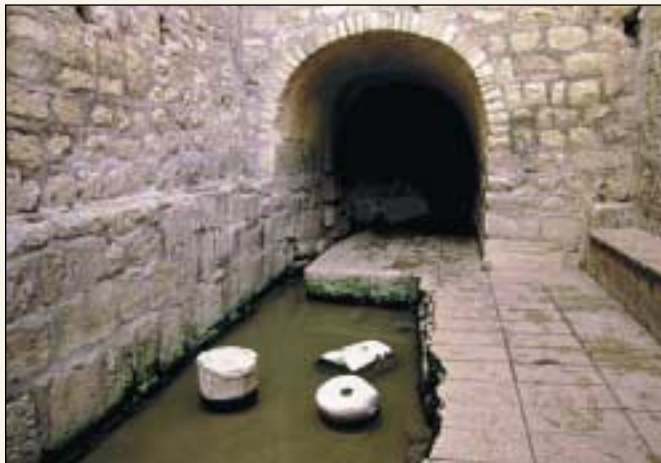
Der Siloah-Teich wird in Zusammenhang mit einer der Wunderheilungen Jesu Christi erwähnt. Obwohl die Überreste des Teiches sich sehr verändert haben, kann der Teich immer noch besucht werden. Der Teich, der in der ursprünglichen Stadt Davids liegt, wird von der Gihon-Quelle genährt.

Archäologen fanden viele alte Gräber und andere Grabstätten in Israel. Es waren einfache Erdlöcher von einem Stein bedeckt bis hin zu extravaganten Grabkammern für die Reichen. Die International Standard Bible Encyclopedia sagt: „Bei Verstorbenen ohne festen Wohnsitz mußte die Bestattung am Straßenrand stattfinden ... Unter griechisch-römischen Einfluß richteten sich die äußeren Formen und Ornamente nach der klassischen Architektur ... Alles, was zu sehen war, wurde übertüncht, damit Unreinheit durch einen zufälligen Kontakt in der Nacht vermieden wurde (Matthäus 23,27)“ (1979; Band 1; Seite 557, 559; Stichwort „Burial“).