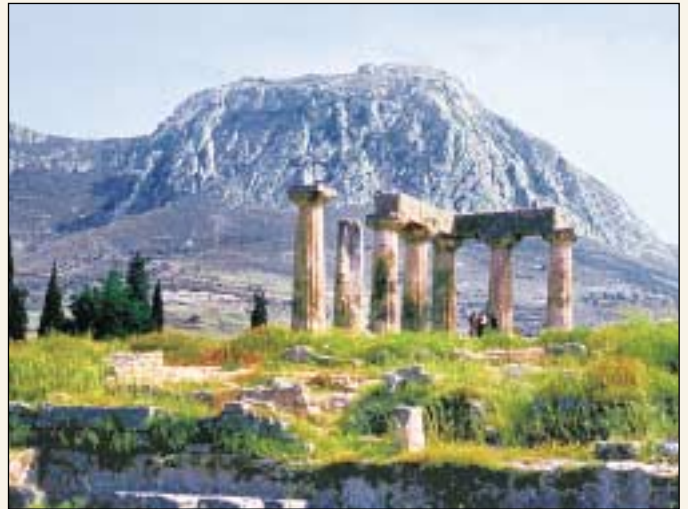
Paulus blieb „ein Jahr und sechs Monate“ in Korinth (Apostelgeschichte 18,11. Später schrieb er zwei Briefe an die Gemeinde dort. Im Bild oben sieht man die Ruinen der griechischen Stadt Korinth.

Von allen griechischen Städten war Korinth am bekanntesten für sexuelle Unmoral. „Die antike Stadt stand im Ruf eines vulgären Materialismus“, stellt The Bible Knowledge Commentary fest. „In der frühesten griechischen Literatur wurde sie in Zusammenhang mit Reichtum und Unmoral gebracht. Wann immer sich Platon auf eine Prostituierte bezog, nannte er sie ein ‚korinthisches Mädchen‘. Laut Strabo, dem griechischen Geographen, drehte sich ein Großteil von Korinths Reichtum und Sittenlosigkeit um den Tempel der Aphrodite mit seinen Tausenden von Tempelprostituierten. Aus