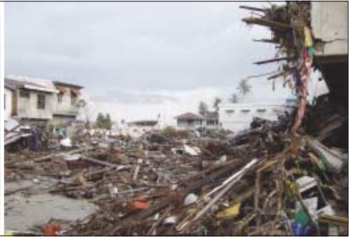
Beispielhaft für die zerstörerische Kraft des Tsunamis am 26. Dezember 2004 ist die Verwüstung dieses Fischerdorfs an der Küste Sumatras in Indonesien. Nur feste Strukturen wie diese Moschee