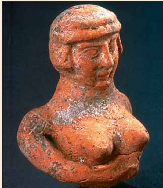
Die kanaanitische Religion übte große Anziehungskraft auf die Israeliten aus. Abgebildet sind eine Statuette von Baal, links, dem Wettergott, und eine Fruchtbarkeitsgöttin. Die Baalfigur hielt anscheinend ursprünglich einen Blitz in der Hand.