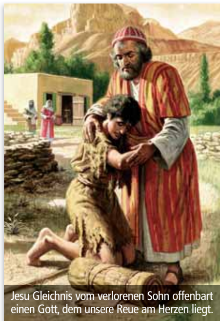
Jesu Gleichnis vom verlorenen Sohn offenbart einen Gott, dem unsere Reue am Herzen liegt.

fenden Lebensführung verprasste. Schließlich geht ihm das Geld aus, und das Land leidet unter einer Hungersnot (Verse 13-14). In seiner Not bietet er sich als Schweinehirte an, eine demütigende Arbeit für einen Juden. Er ist so hungrig, dass er die Futterreste essen möchte, die ihm aber niemand gibt (Verse 15-16).