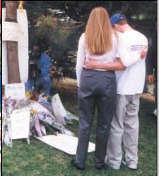
Schüler, Familien, Freunde und eine geschockte Kommune versammelten sich am Tag nach dem Massaker in einem angrenzenden Park. Viele legten Blumen, Briefe und Stofftiere als Ausdruck ihrer Trauer über die unfaßbare Tragödie nieder.

standen. Schüler von den Nachbarschulen drückten ihre Anteilnahme durch Karten und Poster aus, die sie auf die Blumenberge legten.