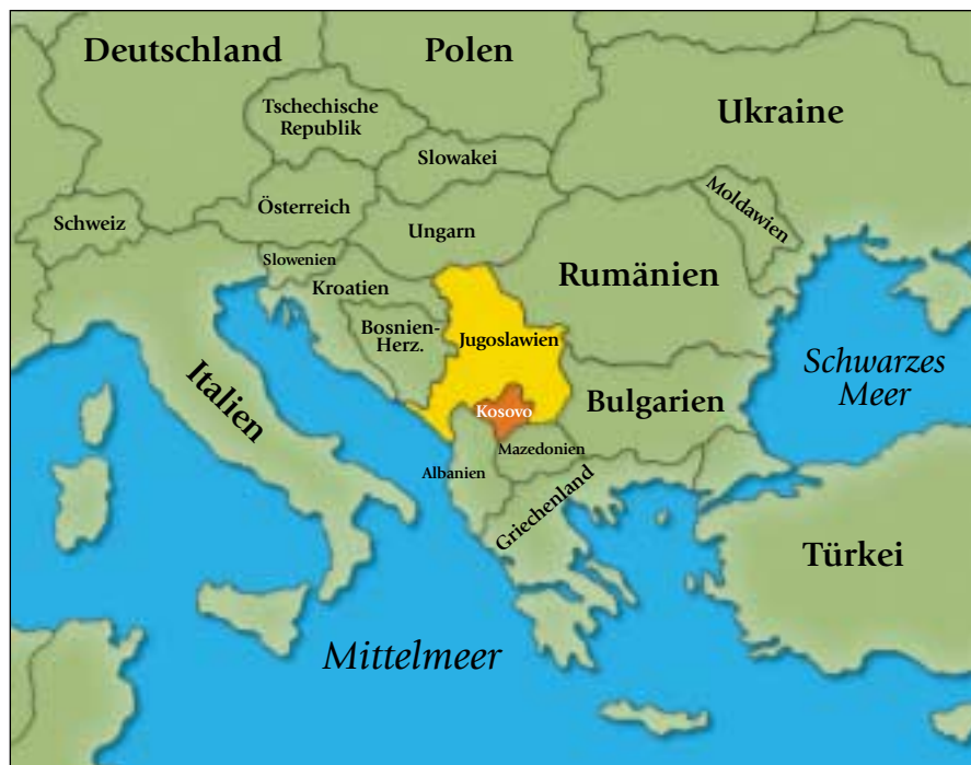
Der Zusammenbruch des Kommunismus in Osteuropa hat zu neuen bzw. veränderten Bündnissen, neuen Grenzen und neuen Ländern geführt. Leider offenbarte der Wegfall einer übergeordneten Machtstruktur noch bestehende, alte ethnische Differenzen.

Die Massendeportation von Kosovo-Albanern und die in den ersten Tagen nach dem Einzug der Kfor-Friedenstruppen im Kosovo aufgedeckten Massengräber, die auf ethnische Säuberungsmassaker hinweisen, erinnern an ähnliche Tragödien, die mehrfach in diesem Jahrhundert stattfanden — auch in Europa. Der britische Außenminister Robin Cook verglich die ethnische Säuberung im Kosovo hinsichtlich ihrer „Begründung“ mit dem Holocaust. Den kürzlich verübten und den früheren Greuelthaten läge dieselbe „giftige Doktrin“ der Rassenüberlegenheit zugrunde, meinte Außenminister Cook in einem Interview mit dem britischen Rundfunksender BBC.