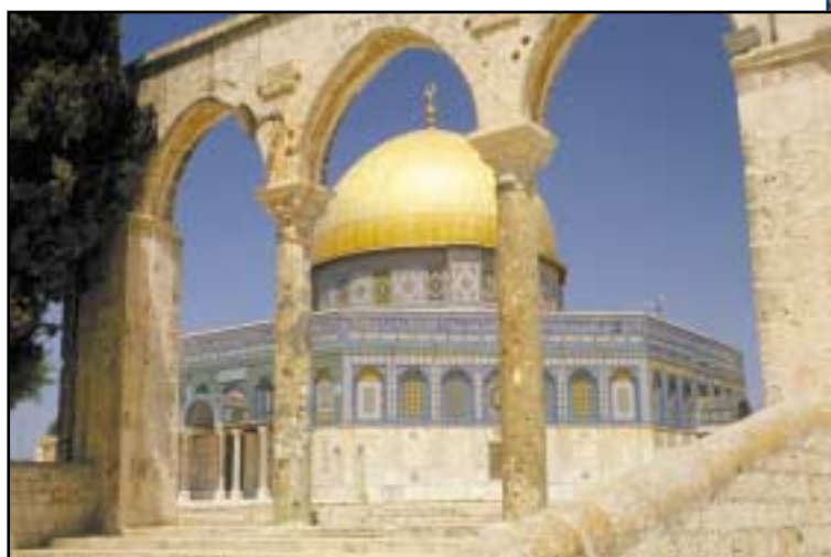
Der Felsendom auf dem ehemaligen Gelände des Tempelberges ist eine beliebte Stätte der Anbetung für Muslime. Seit der Eroberung des Ostteils der Stadt Jerusalem in 1967 fordern auch jüdische Fundamentalisten Zugang zu diesem Gelände, um Gott hier anbeten zu können.