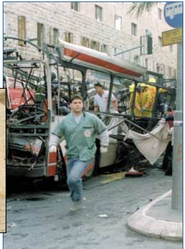
Zur Realität des Lebens in Jerusalem gehören terroristische Anschläge wie die Bombe, die diesen Bus im März 1996 auseinanderriß.