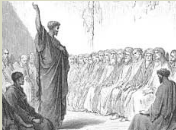
Der Holzschnitt von Gustav Doré zeigt den Apostel Paulus beim Predigen des Evangeliums in Thessalonich. Die Lehre und Praktiken der neutestamentlichen Apostel unterschieden sich bedeutend von den Vorstellungen des heutigen Christentums.

Damit weisen wir auf einige der Hauptunterschiede zwischen dem heutigen Christentum und dem Christentum zur Zeit Jesu und der Apostel des Neuen Testaments hin. GN