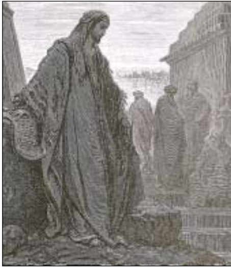
Der Prophet Daniel schrieb mehrere erstaunlich genaue Prophezeiungen nieder. Sie sind so genau und detailliert, daß Kritiker den Zeitpunkt ihrer Abfassung nach den in ihnen vorausgesagten Ereignissen datieren.

Da Porphyry ein Feind des Christentums war, sind Zweifel an seiner Objektivität erlaubt. Seine Meinung