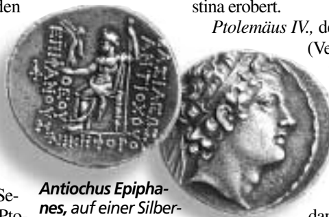
Antiochus Epiphanes, auf einer Silbermünze aus der Zeit seiner Herrschaft abgebildet, verbot viele Aspekte der jüdischen Religion und entheiligte den Tempel in Jerusalem.

Vers 17: „Und er wird seinen Sinn darauf richten, daß er mit Macht sein ganzes Königreich bekomme, und sich mit ihm vertragen und wird ihm seine Tochter zur Frau geben, um ihn zu verderben. Aber es wird ihm nicht gelingen, und es wird nichts daraus werden.“