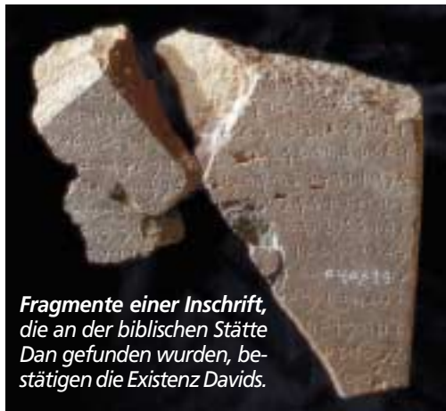
Fragmente einer Inschrift, die an der biblischen Stätte Dan gefunden wurden, bestätigen die Existenz Davids.

Obwohl diese Inschrift und andere Funde die Argumente derer schwächen, die die biblische Darstellung der Geschichte ablehnen, muß uns bewußt bleiben, daß es unmöglich ist, alle biblischen Ereignisse mit Hilfe der Archäologie nachzuweisen. Eine Vielzahl der ursprünglichen Zeugnisse sind nicht mehr vorhanden, weil viele Stoffe sich längst abgebaut haben. Die Suche nach Hinweisen auf eine bestimmte Person gleicht der Suche nach einer Nadel in einem riesigen Heuhaufen.