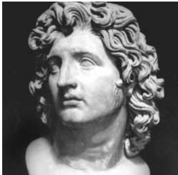
Der Aufstieg des griechisch-mazedonischen Reiches unter Alexander dem Großen wurde von dem Propheten Daniel lange vor der Geburt Alexanders vorausgesagt.