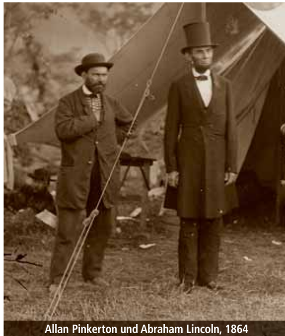
Allan Pinkerton und Abraham Lincoln, 1864

Seit der Zeit Allan Pinkertons ist das Sicherheitsbedürfnis nicht geringer geworden. Heute benutzen Unternehmen und Familien