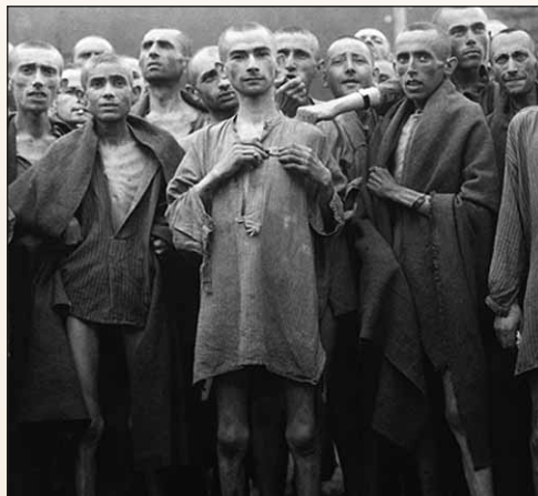
Das evolutionäre Konzept vom „Überleben der Lebenstüchtigsten“ lieferte eine Rechtfertigung für Adolf Hitlers Rassenpolitik.

Diese Beweise haben so viel Gewicht, dass sogar einige bedeutende Wissenschaftler, die nicht gottgläubig sind, den Mut gehabt haben, den Tatsachen ins Auge zu sehen . . . Die vernünftigste Antwort auf die Frage: ‚Schöpfung – ja oder nein?‘ ist: ‚Ja, Schöpfung auf irgendeine Art‘“ ( Creation and Evolution: Rethinking the Evidence from Science and the Bible , 1985, Seite 65; Hervorhebung durch uns).