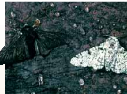
Der Birkenspanner wird oft als modernes Beispiel der Evolution erwähnt. Bei näherer Untersuchung jedoch erweist sich diese Behauptung als falsch.

Darwin maß die Schnabelgrößen der Finken auf einer Insel und bemerkte einen leichten Unterschied zu den Schnäbeln der Vögel auf der benachbarten Insel. Er schrieb: „Wenn man diese Abstufung und Vielfalt der Struktur in einer kleinen, eng verwandten Gruppe von Vögeln sieht, dann könnte man wirklich meinen, dass durch einen Originalmangel an Vögeln in diesem Archipel eine Art dafür diene, um zu unterschiedlichen Ergebnissen modifiziert zu werden“ (zitiert aus Darwins Werk in Contemporary Biology , 1973, Seite 550).