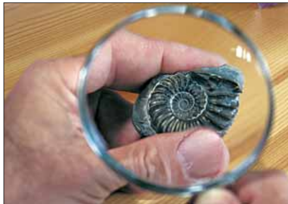
Fossilien vieler Spezies wurden gefunden, die alle ihrem Habitat ideal angepasst waren. Paläontologen räumen jedoch das Fehlen von Zwischengliedern ein, deren Entdeckung Charles Darwin vorausgesagt hatte.