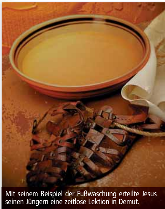
Mit seinem Beispiel der Fußwaschung erteilte Jesus seinen Jüngern eine zeitlose Lektion in Demut.

und dass er von Gott gekommen war und zu Gott ging“ (Johannes 13,3). Jesus erkannte, dass die Zeit gekommen war, um den Schmutz menschlichen Hochmuts zu entfernen.