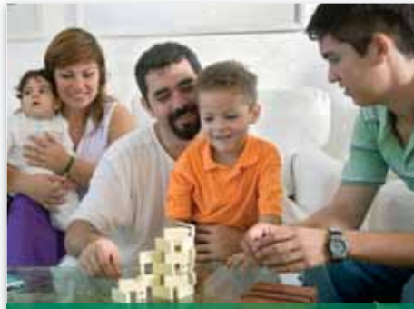
Der Umgang mit Ihren Kindern

Wie sieht es bei Ihnen aus? Zerfallen Ihre Familienbände, weil der moderne Werteverfall auch vor Ihrer Haustür nicht halt gemacht hat? Verschlingt die Nutzung der modernen Technologien immer mehr Zeit und Aufmerksamkeit? Wenn Sie Ihre Familienbeziehung stärken bzw. wiederherstellen wollen, dann können Sie das! Zuerst müssen der Schöpfergott und seine universellen Werte das Fundament in unserem Leben sein, denn sie geben uns die richtige Perspektive und Richtung. Darüber hinaus sehen wir uns fünf Schlüssel an, die die Türen zu einer glücklicheren Familie öffnen können.