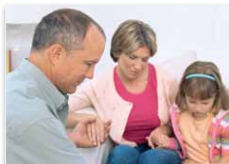
Erziehen Sie Ihre Kinder

Der Schöpfergott hält uns verantwortlich für unsere Kinder. Wir haben sie nur für ein paar Jahre, sie werden aber immer Gottes Kinder sein. Nehmen Sie Ihre von Gott gegebene Verantwortung ernst und folgen Sie nicht dem Beispiel unserer modernen Gesellschaft.