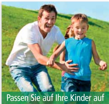
Passen Sie auf Ihre Kinder auf

Wenn Sie Ihrem Kind ein gutes Beispiel geben, wird es ihm helfen, ein glückliches und geborgenes Leben zu haben, das es später an seine eigene Familie weitergeben kann.