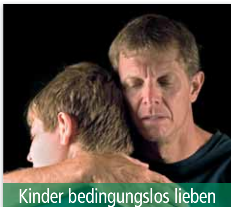
Kinder bedingungslos lieben

Wir diskutierten mit ihnen die Tatsache, dass Fernsehen ein kommerzielles Geschäft ist und die Unterhaltungsindustrie die Zuschauer ansprechen will, um ihnen Produkte zu verkaufen oder Ideen zu vermitteln. Heute lehren unsere Kinder unsere Enkelkinder die gleichen Prinzipien.