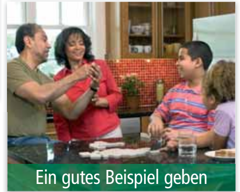
Ein gutes Beispiel geben

Es kann sein, dass Ihnen diese Art der Kommunikation mit Ihren Kindern nicht liegt, aber ich habe bei Besuchen bei anderen Familien viel schlimmere Dinge gehört. Das tat mir für die Familie und besonders für die Kinder sehr leid.