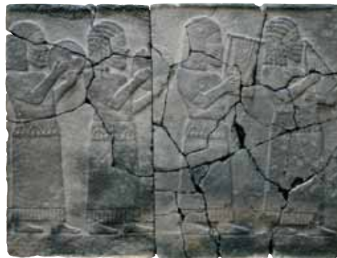
Diese Steintafel aus einem hethitischen Palast zeigt hethitische Musiker mit verschiedenen musikalischen Instrumenten.

Jahrhundertlang konnten die einzigen bekannten Hinweise auf die Hethiter nur in der Bibel gefunden werden. Daher sind einige