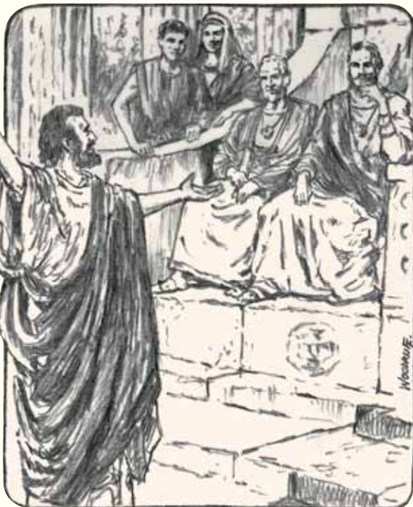
Grafik von Michael Woodruff

dir: Heute, in dieser Nacht, ehe der Hahn zweimal kräht, wirst du mich dreimal verleugnen. Er aber redete noch weiter: Auch wenn ich mit dir sterben müsste, werde ich dich nicht verleugnen! Das gleiche sagten sie alle“ (Markus 14,27-31).