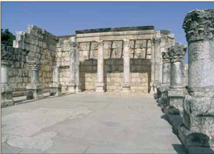
Diese Kalkstein-Synagoge in Kapernaum wurde entweder im 4. oder im 5. Jahrhundert auf dem Fundament eines Gebäudes aus dem 1. Jahrhundert erbaut. Das frühere Gebäude war wahrscheinlich die Synagoge, in der Jesus gelehrt hatte.

Wie war der Anfang der Kirche, die Jesus Christus gegründet hatte? Ein Zeitzeuge berichtet, dass nach der Auferstehung und Himmelfahrt Jesu Christi seine Jünger auszogen „und . . . an allen Orten [predigten]. Und der Herr wirkte mit ihnen und bekräftigte das Wort durch die mitfolgenden Zeichen“ (Markus 16,20). Jesu Gemeinde erlebte einen kraftvollen Auftakt.